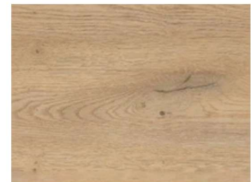
Türen und Böden Eiche Dekor