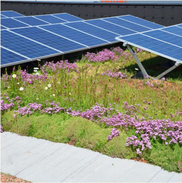
Dachbegrünung und Photovoltaik