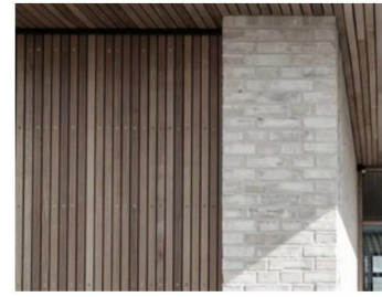
Fassade Kombination Verblender und Holz