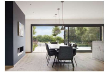
Farbige Fenster mit Textil-Screens